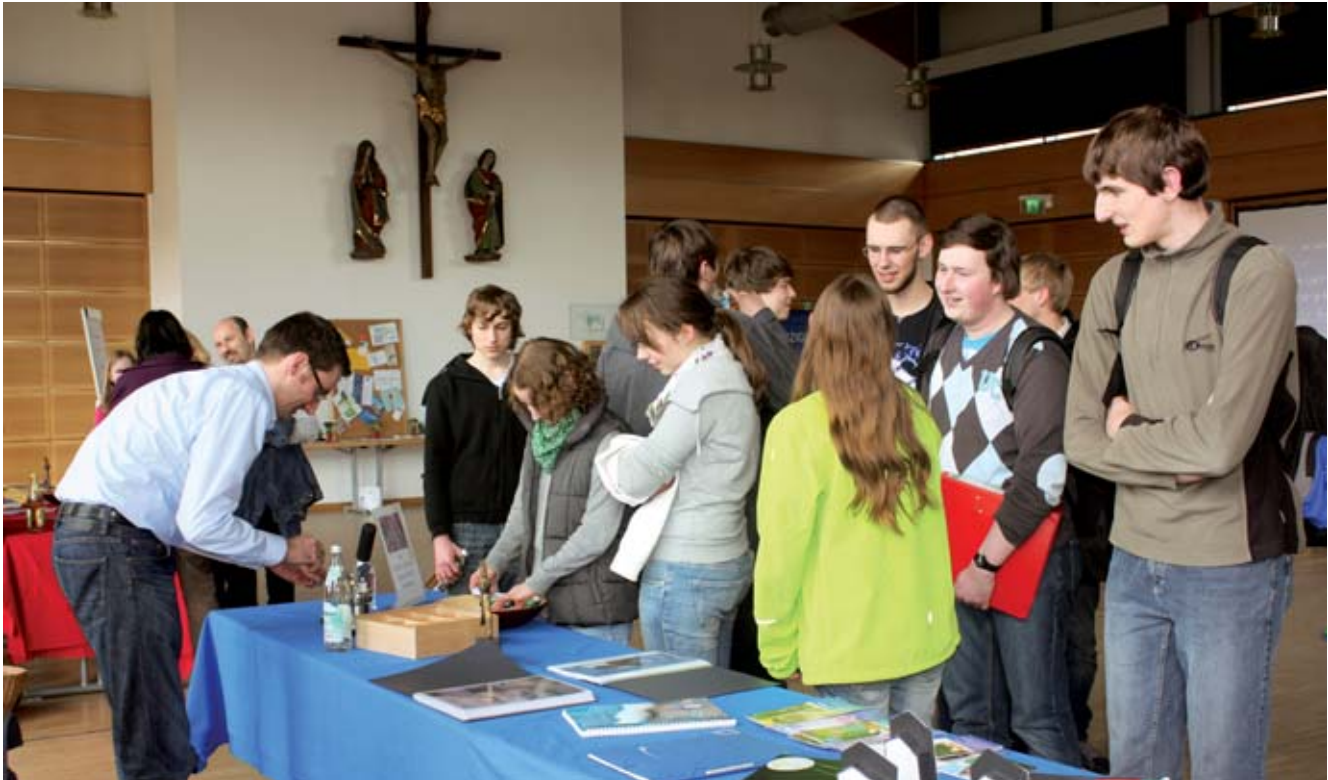
HEP-Days in Straubing: Reger Andrang an den Ständen

für ein berufsorientierendes Praktikum und eine Aus- und Weiterbildung zum/ zur Heilerziehungspfleger/in und Heilerziehungspflegehelfer/in zu animieren.