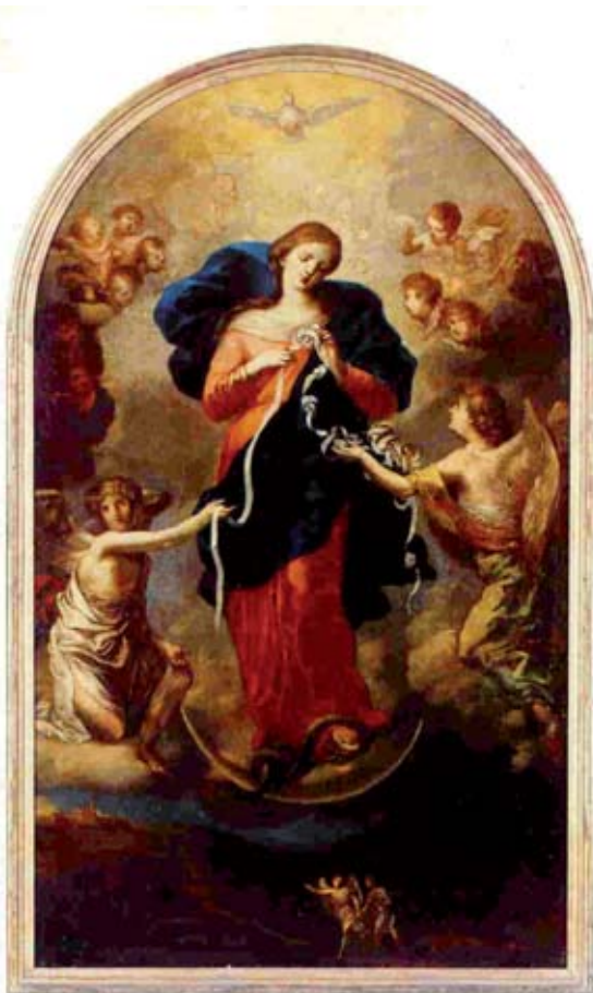
Altarbild der Wallfahrtskirche St. Peter am Perlach in Augsburg

Eltern: „Warum habt ihr mich gesucht?“ (Lk 2,49) Bei der Hochzeit zu Kana bekommt die sorgende Maria zur Antwort: „Was willst du von mir, Frau?“ (Joh 2,4) Und als sie einmal draußen vor der Tür wartet, meint Jesus: „Wer ist meine Mutter?“ (Mk 3,33) Nicht gerade Antworten, die man von einem göttlichen Kind erwartet!