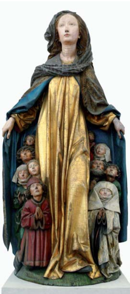
Die Ravensburger Schutzmantelmadonna

Ein anderes altes Mariengebete könnte Menschen im Krankenhaus auch sehr aus dem Herzen sprechen: das „Salve Regina“, das seit 1135 in die Liturgie der Kirche Eingang gefunden hat: