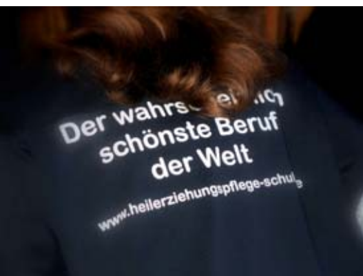
Ein klares Bekenntnis auf dem T-Shirt ...

Neben einer verstärkten Information und Werbung für die Aus- und Weiterbildung in diesem Bereich beschlossen