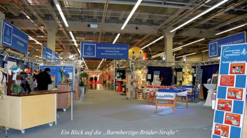
Ein Blick auf die „Barmherzige-Brüder-Straße“