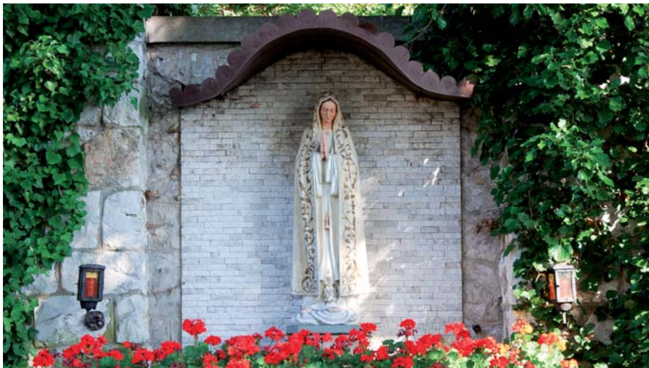
Bei dieser Marienfigur im Park des Krankenhauses St. Barbara in Schwandorf finden jedes Jahr auch Maiandachten statt.

Sei begrüßt, o Königin, Mutter der Barmherzigkeit; unser Leben, unsere Wonne und unsere Hoffnung sei begrüßt! Zu dir rufen wir verbannte Kinder Evas; zu dir seufzen wir trauernd und weinend in diesem Tal der Tränen. Wohlan denn, unsere Fürsprecherin, wende deine barmherzigen Augen uns zu und nach diesem Elend zeige uns Jesus, die gesegnete Frucht deines Leibes! O gütige, o milde, o süße Jungfrau Maria.