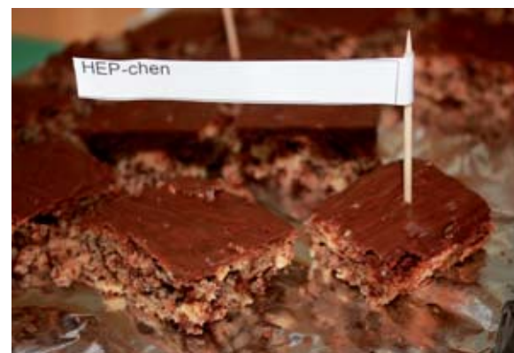
„HEP-chen“ für die Gäste

Staatliche Förderungen für Aus- und Weiterbildung wurden in den letzten Jahren immer mehr zurückgefahren. Damit hat sich die traditionell berufsbegleitende Form der Aus- und Weiterbildung in der Heilerziehungspflege nicht nur aus pädagogischen, sondern auch aus finanziellen Gründen als segensreich erwiesen. In der dreijährigen Ausbildung sind alle Fachschüler neben Unterricht und praktischem Ausbildungsteil in der Heilerziehungspflege angestellt und bekommen Gehalt. In der einjährigen Helferausbildung soll nun dieses berufsbegleitende Bildungsmodell ebenfalls umgesetzt werden. Allen interessierten Fachschülern wird zusätzlich zum