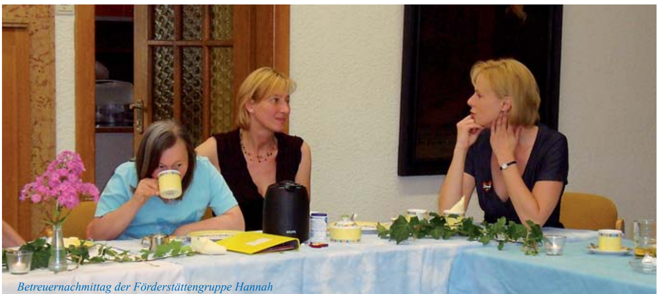
Betreuernachmittag der Förderstättengruppe Hannah