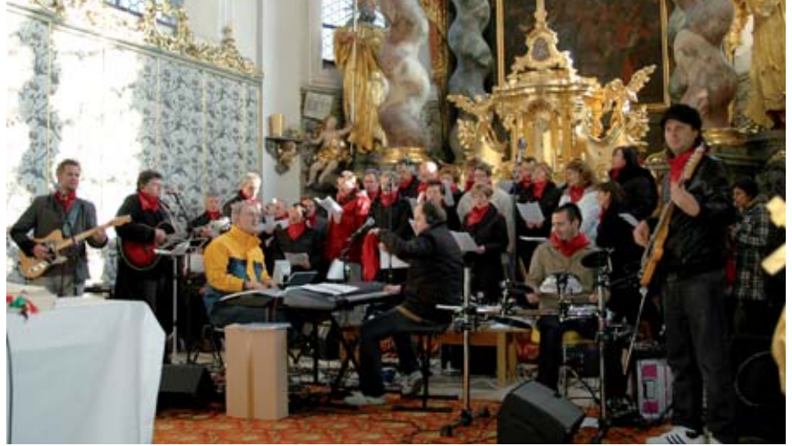
Beeindruckten bei ihren gemeinsamen Auftritten: die Musikerinnen und Musiker aus dem österreichischen Kainbach und dem bayerischen Reichenbach