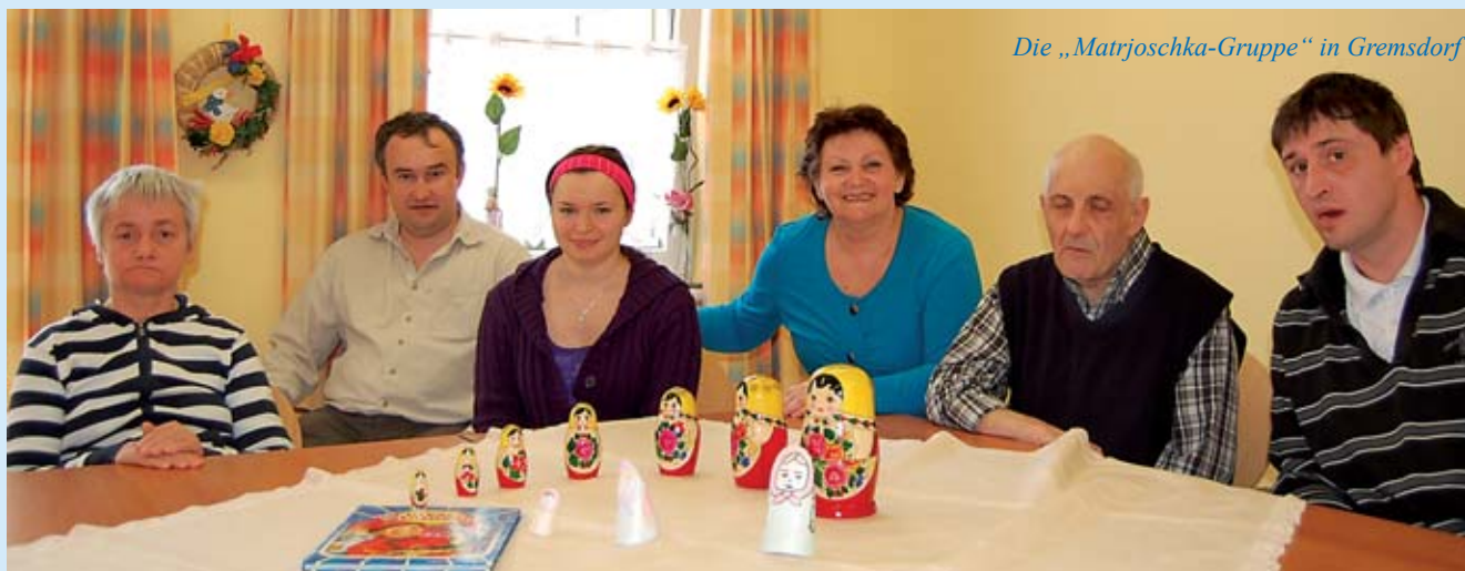
Die „Matrjoschka-Gruppe“ in Gremsdorf