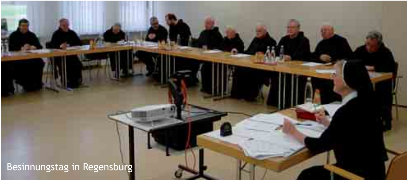
Besinnungstag in Regensburg