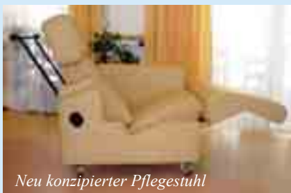
Neu konzipierter Pflegestuhl

Im Herbst 2003 wurde in der Einrichtung für Menschen mit Behinderung der Barmherzigen Brüder in Algasing die Gruppe „Raphael“ mit neun Plätzen speziell für Huntington-Erkrankte gegründet. 2008 wurde die Kapazität auf