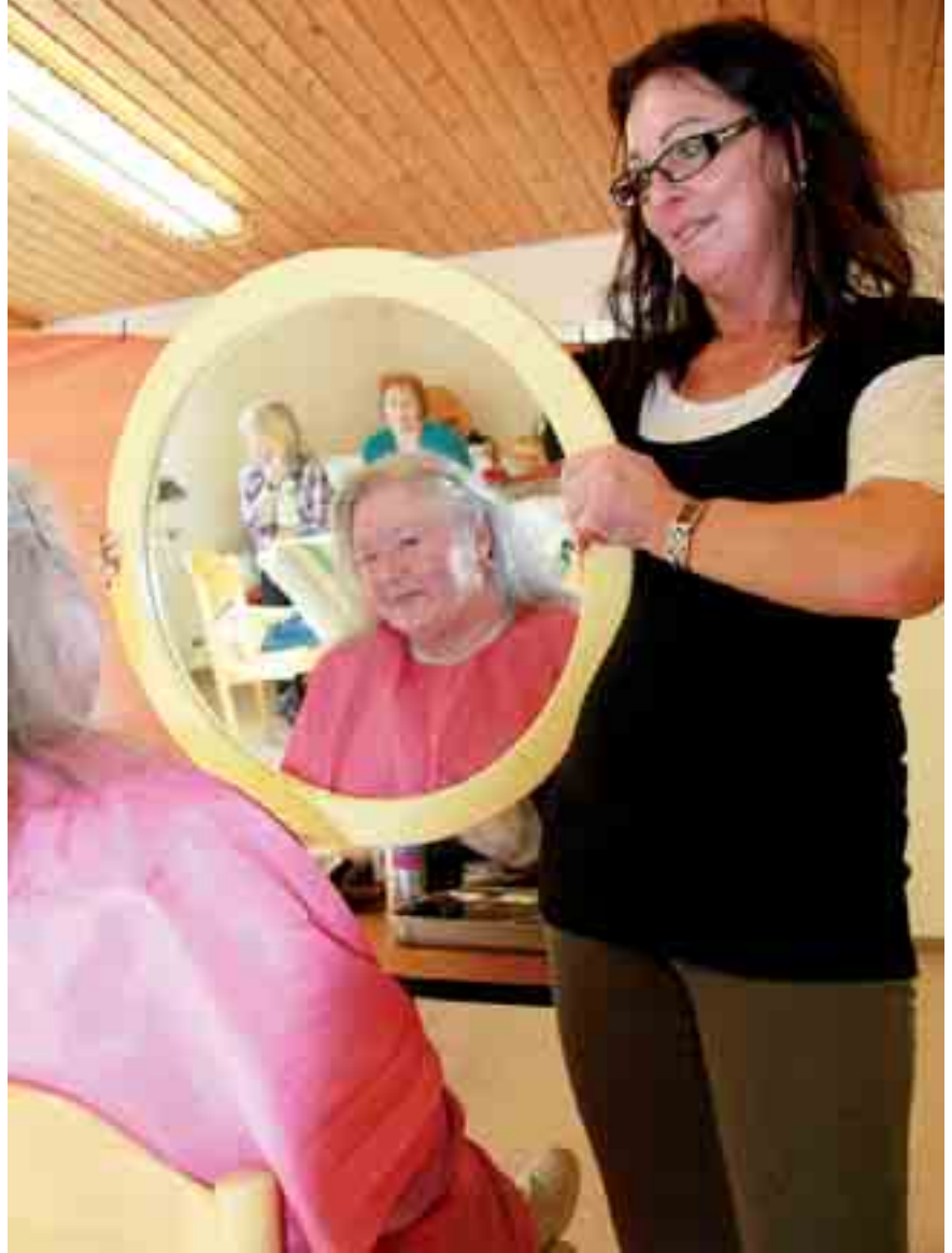
Bin ich schön? Die Frage erübrigt sich nach einer Behandlung im Algasinger Schönheitssalon.

Durch eine offene, interessierte und aufrichtige Haltung gewinnt jedes Gespräch, und sei es noch so kurz, an Wert. Aktives Zuhören, Körpersprache, Gesprächsstrategien – vieles kann man lernen. Aufmerksamkeit, Empathie und Wertschätzung sind jedoch Werte, die unsere Mitarbeiter mitbringen müssen. Dieser Herausforderung stellen wir uns täglich. ■