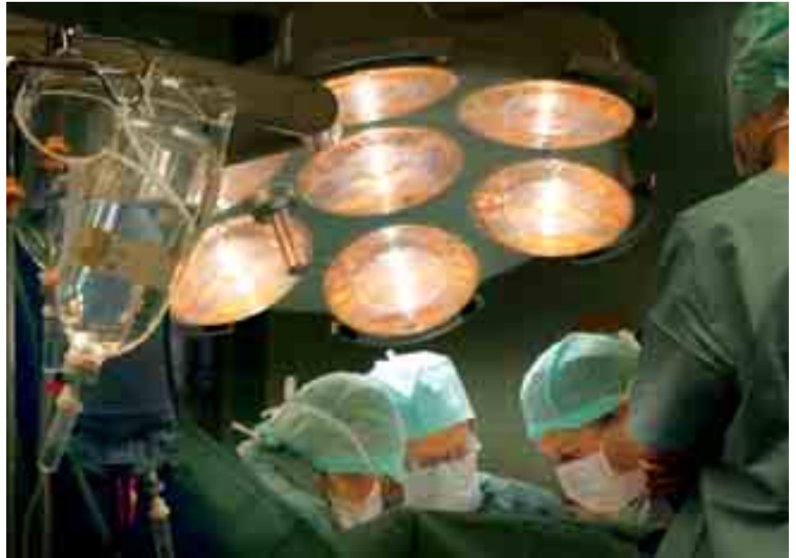
Die umfangreicheren Möglichkeiten der heutigen Medizin haben dazu beigetragen, dass die Frage „Was soll ich tun?“ für Patienten, Pflegende und Ärzte im Krankenhaus nicht mehr in allen Fällen so einfach zu beantworten ist wie noch vor wenigen Jahrzehnten.

Wegen der Notwendigkeit zeitnaher Entscheidungen und der Brisanz ethischer Fragestellungen im Gesundheitsbereich sind Ende 2010 als Ergänzung in allen Krankenhäusern der Ordensprovinz Ethikkomitees berufen worden (siehe Liste auf Seite 11). Schwerpunkt ihrer Arbeit ist es, sich mit konkreten ethischen Fragen einzelner Patienten zu befassen. Ferner sollen die Ethikkomitees der einzelnen Krankenhäuser auch eine beratende Funktion für die örtliche Geschäftsführung und das örtliche Direktorium wahrnehmen und nach in-