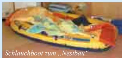
Schlauchboot zum „Nestbau“

Morbus Huntington (in der Umgangssprache auch Chorea Huntington oder Veitstanz genannt) ist eine erbliche Erkrankung des zentralen Nervensystems mit fortschreitendem Verlauf. Die ersten Anzeichen dieser Krankheit treten meistens zwischen dem 30. und 45. Lebensjahr auf. Ursache der Krankheit ist ein Gendefekt; durch ein fehlerhaft gebildetes Eiweiß kommt es zu einer Stoffwechselstörung im Gehirn, die Nervenzellen „hungern“ und „verhungern“. Die Folge dieses Nervenzellenuntergangs sind motorische Koordinationsstörungen wie einschießende Streckbewegungen, Gang-, Schluck- und Artikulationsstörungen. Auch psychisch-psychiatrische Symptome können den Verlauf begleiten oder im Vordergrund stehen. Eine Heilung ist nicht möglich.