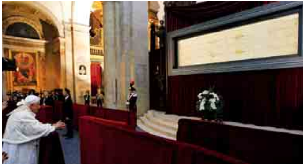
Papst Benedikt XVI. betet am 2. Mai 2010 in der Kathedrale vor dem Turiner Grabtuch.

Ich habe noch den Augenblick im Herzen, als ich während der Pastoralvisite in Turin vor dem Heiligen Tuch in Gedanken und im Gebet vor jenem leidenden Antlitz verweilen konnte, das uns auf Denjenigen zu besinnen auffordert, der das Leiden des Menschen aller Zeiten und Orte auf sich genommen hat, auch unsere Leiden, unsere Mühen, unsere Sünden. Wie viele Gläubige sind im Laufe der Geschichte vor diesem Grabtuch vorbeigegangen, das den Leichnam eines Gekreuzigten umhüllt hatte, das all dem entspricht, was das Evangelium über das Leiden und den Tod Jesu Christi überliefert hat! Es zu betrachten ist eine Aufforderung, sich auf das zu besinnen, was Petrus sagt: „In seinen Wunden seid ihr geheilt“ (1Pt 2,24). (...)