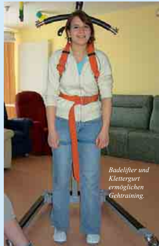
Badelifter und Klettergurt ermöglichen Gehtraining.

Morbus Huntington (in der Umgangssprache auch Chorea Huntington oder Veitstanz genannt) ist eine erbliche Erkrankung des zentralen Nervensystems mit fortschreitendem Verlauf. Die ersten Anzeichen dieser Krankheit treten meistens zwischen dem 30. und 45. Lebensjahr auf. Ursache der Krankheit ist ein Gendefekt; durch ein fehlerhaft gebildetes Eiweiß kommt es zu einer Stoffwechselstörung im Gehirn, die Nervenzellen „hungern“ und „verhungern“. Die Folge dieses Nervenzellenuntergangs sind motorische Koordinationsstörungen wie einschießende Streckbewegungen, Gang-, Schluck- und Artikulationsstörungen. Auch psychisch-psychiatrische Symptome können den Verlauf begleiten oder im Vordergrund stehen. Eine Heilung ist nicht möglich.