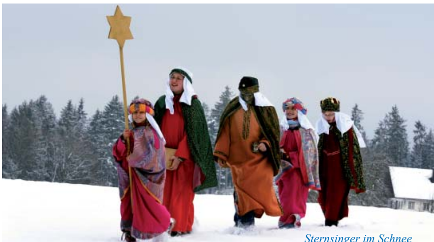
Sternsinger im Schnee

Weitere Informationen finden sich im Internet unter www.dioezesanmuseum-freising.de . ■