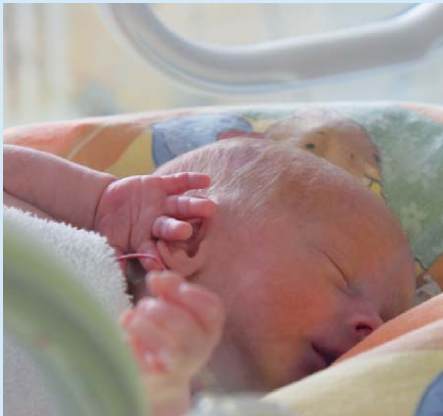
Ein Frühgeborenes auf der Neugeborenen-Intensivstation des Perinatalzentrums an der Klinik St. Hedwig.

Das Perinatalzentrum ist auch besonders darauf spezialisiert, früh- oder risikoge-