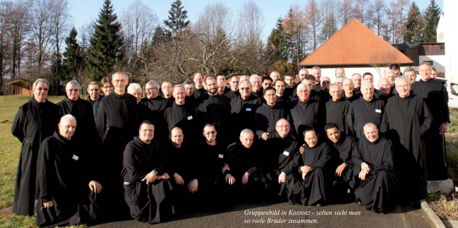
Gruppenbild in Kostenz - selten sieht man so viele Brüder zusammen.