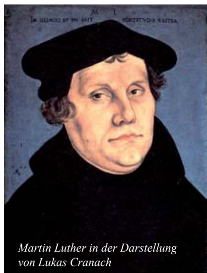
Martin Luther in der Darstellung von Lukas Cranach

stammt: „Es kam ein Engel hell und klar“, besser bekannt unter dem Titel „Vom Himmel hoch da komm ich her“, schrieb Martin Luther im Jahr 1535