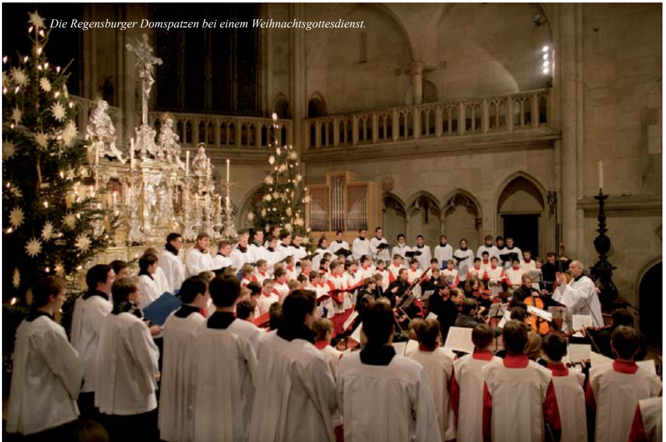
Die Regensburger Domspatzen bei einem Weihnachtsgottesdienst.

Das Weihnachtslied „Es kam ein Engel hell und klar“