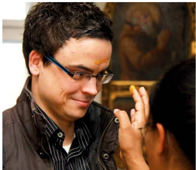
Unter anderem mit Sandelholz-Paste für die Stirn und durch Besprengen mit Rosenwasser wurden die Teilnehmer des Indientags beim Gottesdienst von indischen Ordensschwwestern begrüßt.