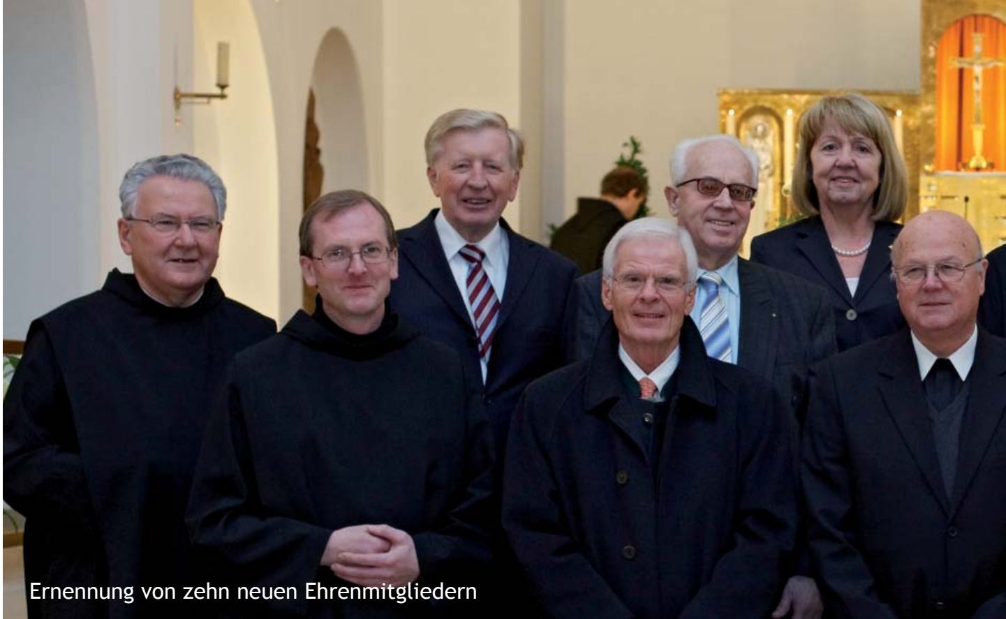
Ernennung von zehn neuen Ehrenmitgliedern