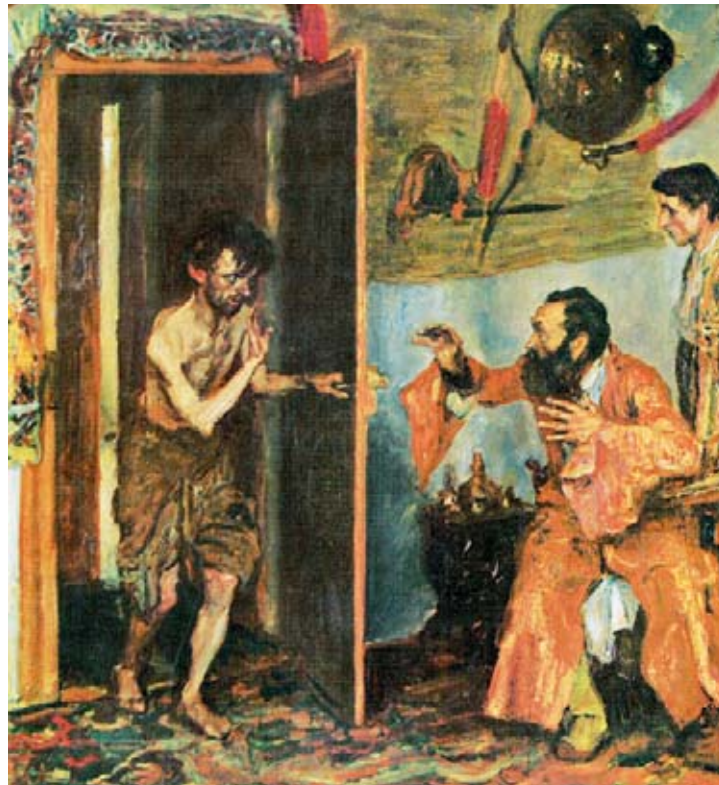
Die Heimkehr des verlorenen Sohnes in der Darstellung des Impressionisten Max Slevogt (1868 - 1932)

Häufig ist Geld ein Faktor, der uns die Nächstenliebe vergessen lässt. Wie viele Beispiele gibt es in unseren Krankenhäusern, Palliativstationen und Hospizen, wo Menschen am Bett ihrer verstorbenen Eltern stehen und so gerne Verzeihung erlangen wollen oder um Verzeihung bitten. Da ist es zu spät. Nutzen wir das Geheimnis der Weihnacht, um wieder enger zusammenzurücken, wenn wir uns voneinander entfernt haben.