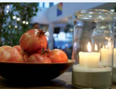
Unser Titelbild mit der Kerze im Glas und den Granatäpfeln - Symbol der Barmherzigen Brüder - entstand beim Adventsmarkt der Barmherzigen Brüder Straubing.

Schwandorf: Stabwechsel in der Seelsorge 17