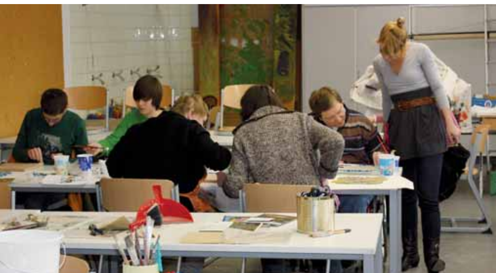
Bild unten Gemeinsames Arbeiten an den Mosaikbildern

Bild Mitte Die Foto-Gruppe begab sich an verschiedene Orte des öffentlichen Lebens, unter anderem stellten Schüler und Bewohner Rollen im Gerichtssaal nach.