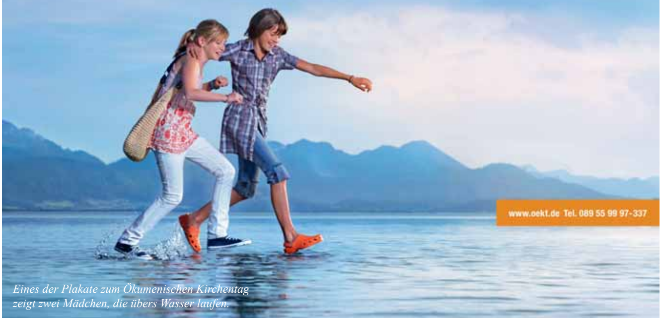
Eines der Plakate zum Ökumenischen Kirchentag zeigt zwei Mädchen, die übers Wasser laufen.

Stand der Orden beim 2. Ökumenischen Kirchentag vom 12. bis 16. Mai in München