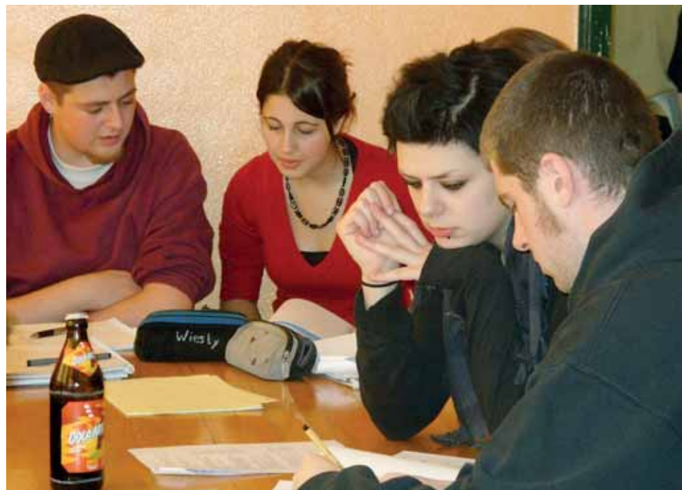
Gruppenarbeit in der Straubinger Fachschule für Heilerziehungspflege

Johannes-Grande-Schule Fachschulen für Heilerziehungspflege und Heilerziehungspflegehilfe Barmherzige Brüder Straubing