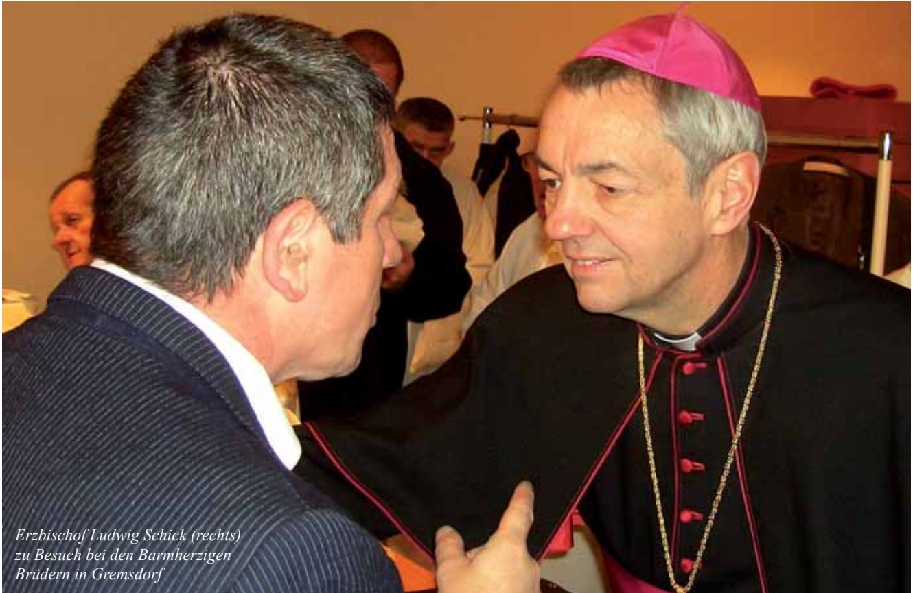
Erzbischof Ludwig Schick (rechts) zu Besuch bei den Barmherzigen Brüdern in Gremsdorf

Interview mit Erzbischof Ludwig Schick zum Schülertag am 18. Mai