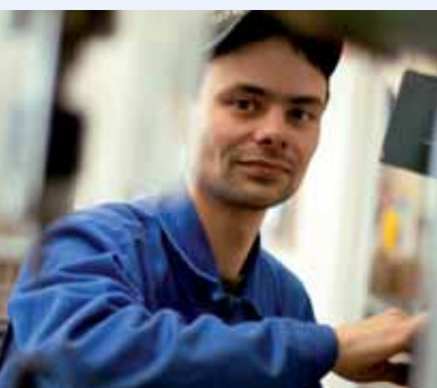
Unser Titelbild entstand in der Werkstatt für behinderte Menschen der Barmherzigen Brüder in Straubing.