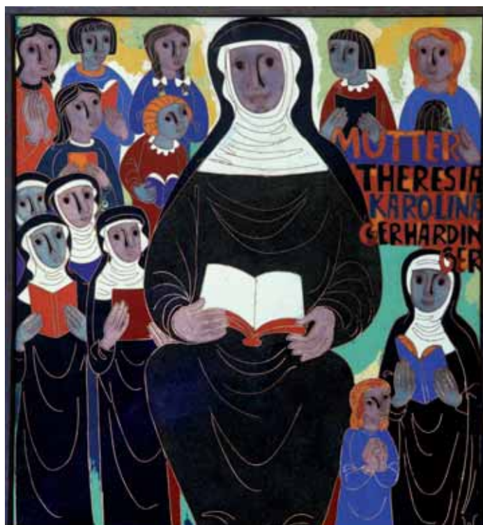
Selige Maria Theresia Gerhardinger, Emailbild von E. Weinert, 1986, Angerkloster München

Aus: Albert Bichler, Freunde im Himmel - Mit bayerischen Heiligen durchs Jahr Fotos von Wilfried Bahn- müller, München (J. Berg Verlag) 2009 19,95 Euro ■