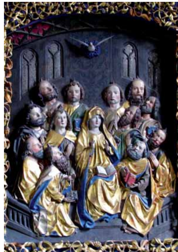
Die Pfingst-Darstellung des gotischen Apostelaltars der Kirche Lieseregg in der Gemeinde Seeboden/Kärnten (um 1500)

Das Charisma der Hospitalität schließt keinen Menschen von der Hilfe und Gastfreundschaft aus. Es begegnet