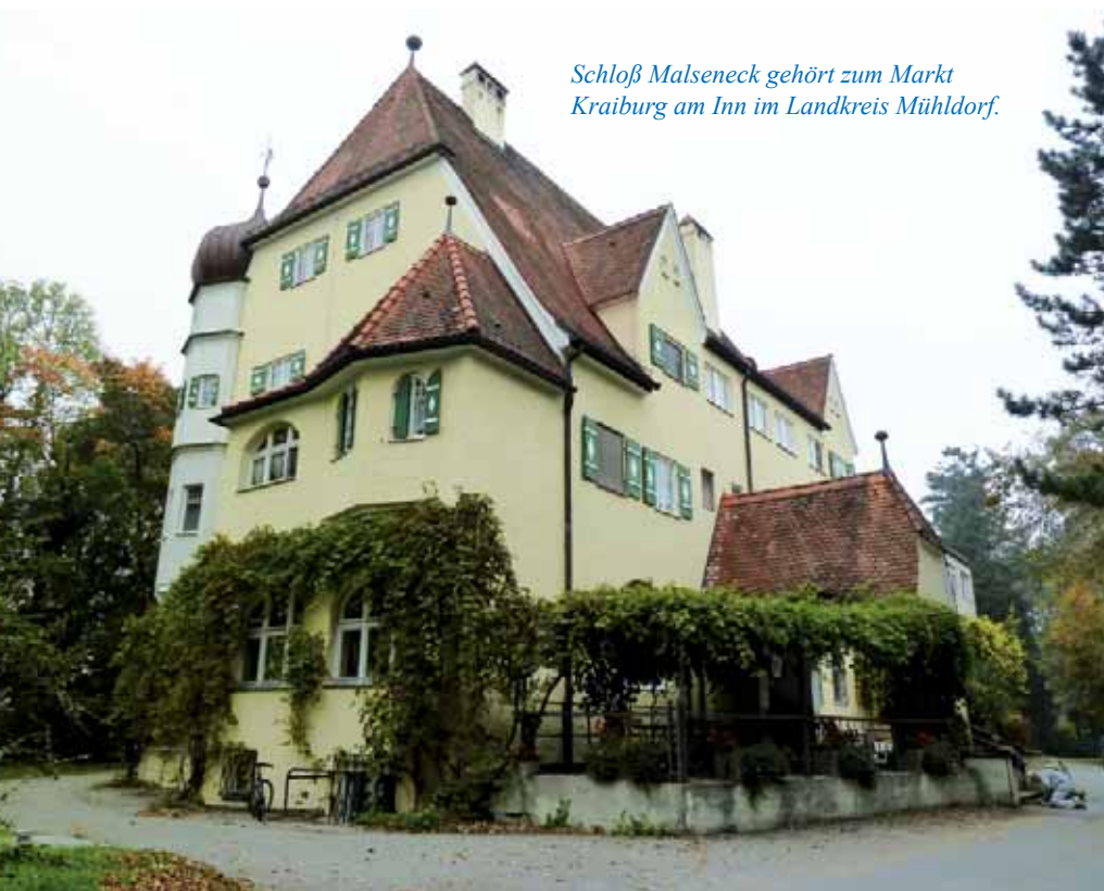
Schloß Malseneck gehört zum Markt Kraiburg am Inn im Landkreis Mühldorf.

behinderte Menschen in Besitz der Alexianer-Brüdergemeinschaft. Während zahlreiche Dienstleistungsangebote der Alexianer im Gesundheitswesen im Osten, Westen und Nordwesten Deutschlands zu finden sind, liegt der überwiegende Teil der Einrichtungen der Bayerischen Ordensprovinz der Barmherzigen Brüder in Bayern, Algasing ist nur 35 Kilometer entfernt. „Schloß Malseneck ist aufgrund der