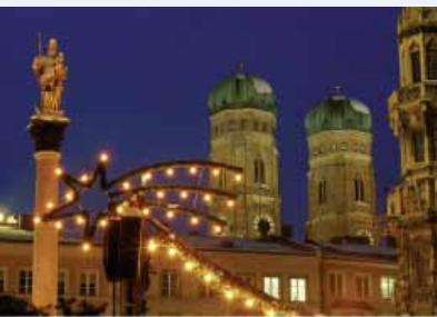
Unser Titelfoto zeigt einen vorweihnachtlichen Blick vom Münchner Marienplatz mit Mariensäule auf die Türme des Liebfrauenmünsters.