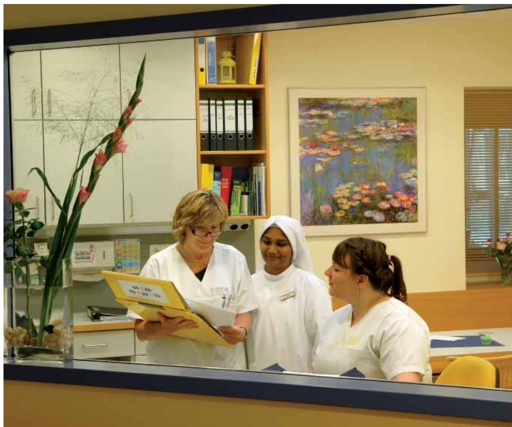
Blick in ein Schwesternzimmer auf der Palliativstation St. Johannes von Gott