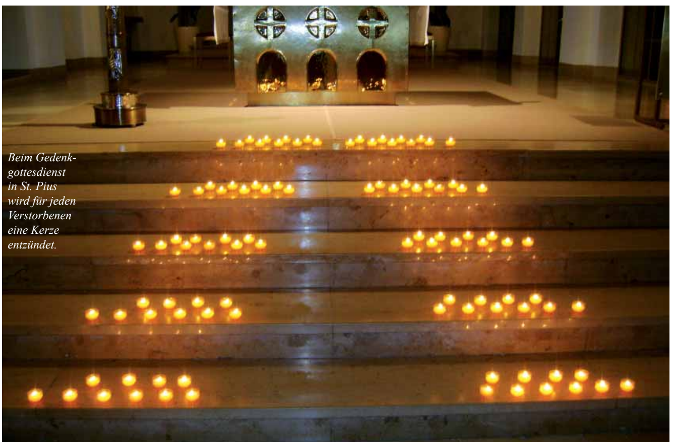
Beim Gedenkgottesdienst in St. Pius wird für jeden Verstorbenen eine Kerze entzündet.

Im Gespräch mit Hinterbliebenen wird manchmal deutlich, dass es für sie tröst-