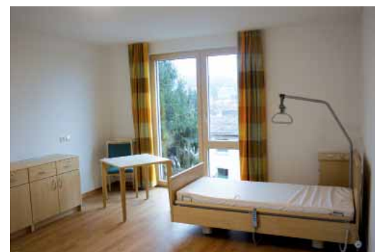
Oben: Ein Bewohnerzimmer und eine Nasszelle