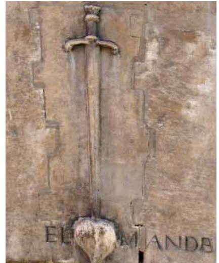
„Das Herz befehle“ - die berühmte Inschrift über dem Eingang des Hauses der Venegas

Die erste Spur an diesem Tag ist das Königliche Hospital, in dem zur Zeit