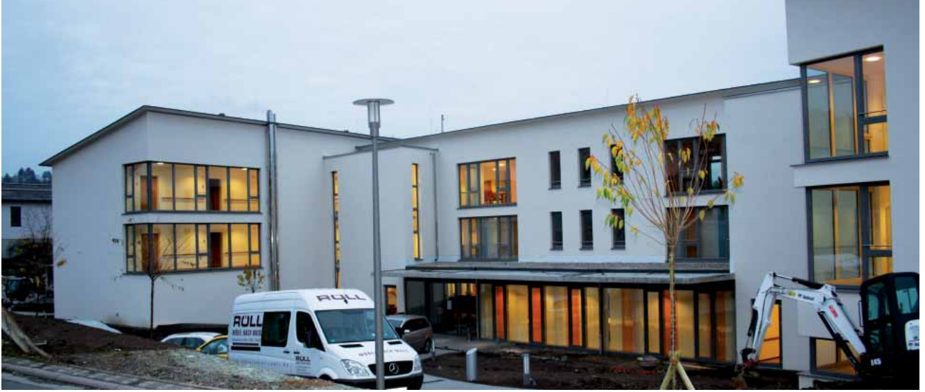
Tag der offenen Tür im neuen Altenheim St. Raphael

Oben: Blick auf den Haupteingang Rechts (Seite 21): Das Info-Material beim Tag der offenen Tür war im Nu vergriffen.