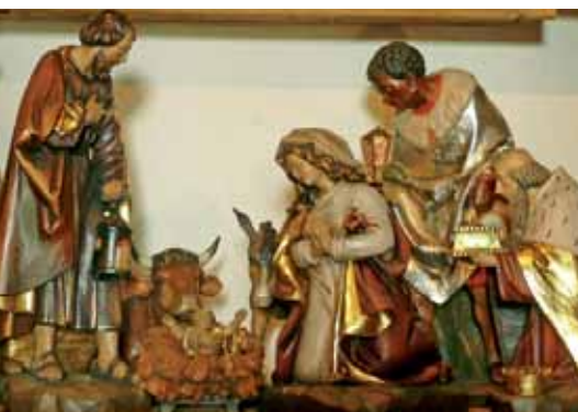
Die Linder-Krippe aus Südtirol – das Lieblings-Exponat der Sammlerin

Besonders nett sind die alten „Glasvogerl mit Schwanzperl“ aus gesponnenem Glas, die neugierig aus einem Fenster schauen. Erinnerungen an altes Weihnachtspapier, das immer wieder