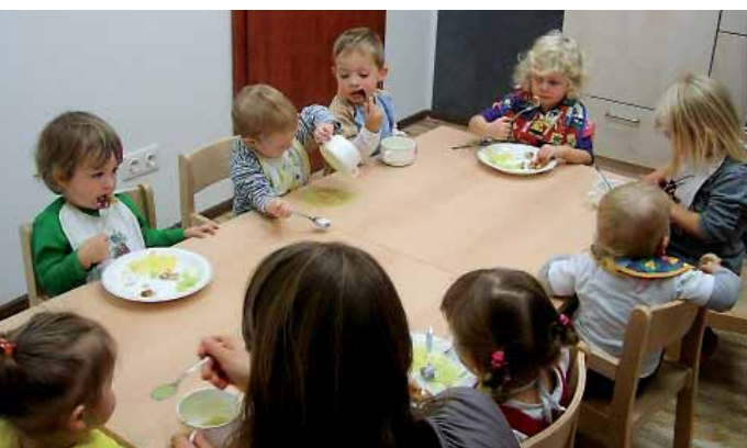
Mhm, das schmeckt – nur einer denkt: „Nein, meine Suppe esse ich nicht!“