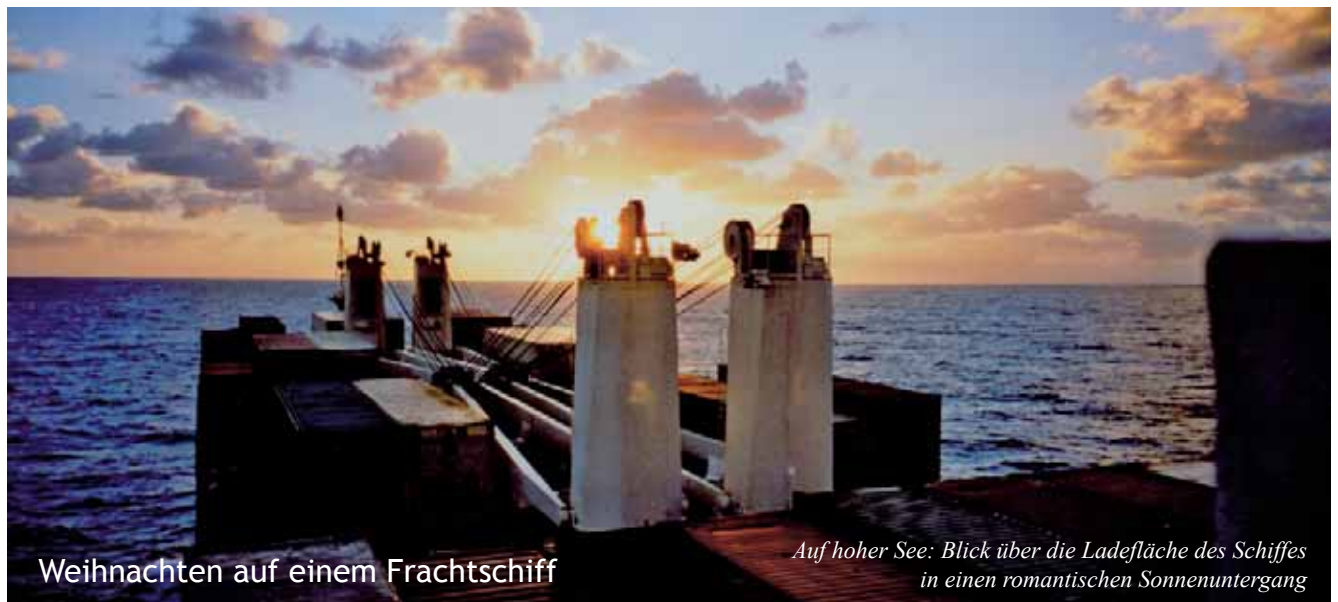
Weihnachten auf einem Frachtschiff