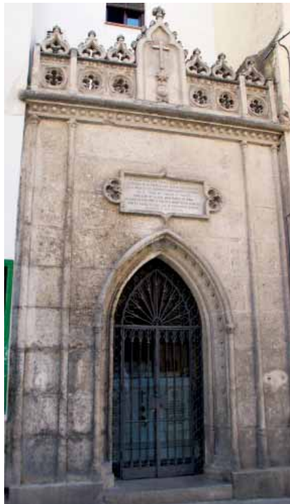
Die kleine Kapelle in der Elviragasse erinnert an den Ort, an dem Johannes von Gott als Buchhändler tätig war. Fotos links (Seite 28) von oben: - Blick vom Albaicín, dem ältesten Stadtviertel Granadas, auf die Alhambra und die Sierra Nevada - das Königliche Hospital - die Reisegruppe im Innenhof der Casa de los Pisa

Nach der Ankunft in Granada marschiert die Reisegruppe vom Hotel zum Haus der Pisa. Die Familie Pisa war eng mit