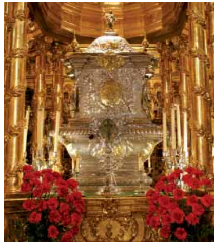
In der Basilica San Juan de Dios befindet sich über dem Hochaltar der Schrein mit den Reliquien des heiligen Johannes von Gott.

Die nächste Spur führt die Gruppe zum Fluss Darro. Der Río Darro mündet in den Fluss Genil, der im Leben des heiligen Johannes von Gott eine entscheidende Rolle spielte. Im Winter 1550