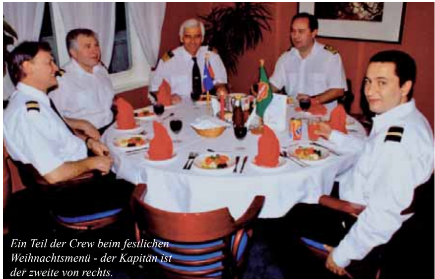
Ein Teil der Crew beim festlichen Weihnachtsmenü - der Kapitän ist der zweite von rechts.

Auf einem Frachtschiff stehen die Passa-