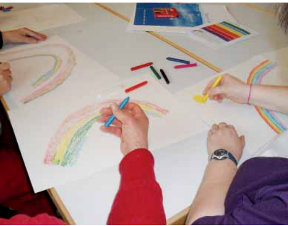
Die Seele malen lassen

ren nicht mehr bei diesem Ministrantenevent dabei waren.