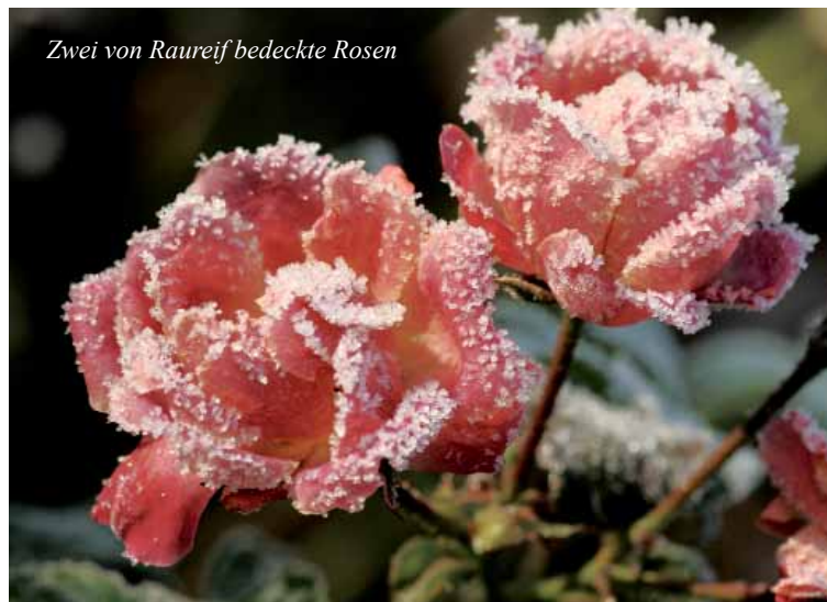
Zwei von Raureif bedeckte Rosen

In der NS-Zeit wurde das Musikstück umgedichtet und für propagandistische Zwecke missbraucht, indem nicht mehr Maria und der Gottessohn besungen wurden, sondern die völkische Gemeinschaft und der Blut-und-Boden-Kult. Die nationalsozialistische Ideologie wurde dabei in ein scheinbar christliches Gewand gekleidet.