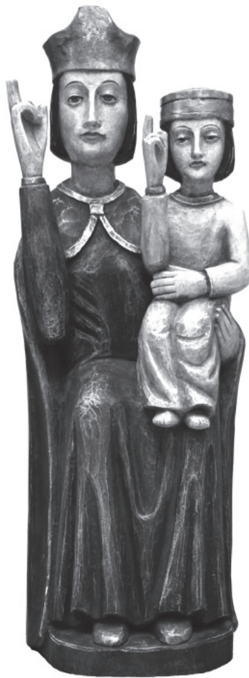
Diese Madonna mit Jesuskind schmückt seit einigen Monaten die Kapelle im Johannes-Hospiz.

Eine Arbeit für den sterbenden Menschen und seine Angehörigen, wie sie in Hospizen angeboten wird und sicherlich keinen Luxus darstellt, ist nur unter finanziell abgesicherten Bedingungen machbar. So bestätigend es auch ist, von Betroffenen, Angehörigen und der Gesellschaft für die Arbeit anerkannt und gelobt zu werden; auf Dauer hilft