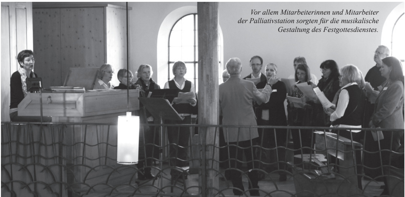
Vor allem Mitarbeiterinnen und Mitarbeiter der Palliativstation sorgten für die musikalische Gestaltung des Festgottesdienstes.

Wer auf der Palliativstation Schwerkranken und Sterbende betreut, sagte Caritasdirektor Lindenberger, der braucht eine Haltung, die den Menschen mit seinen Bedürfnissen in den Mittelpunkt stellt. Eine Haltung, die er vom „Barmherzigen Samariter“ aus dem Lukas-Evangelium lernen kann, der sich – anders als „die Frömmel und geistlichen Scharlatane“ – um den „halb tot“ am Wegesrand liegenden Mann kümmert. js ■